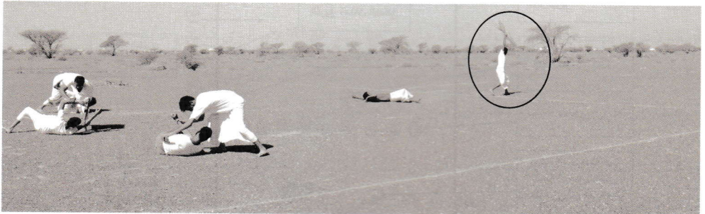
اثناء اقتلاع الرّم